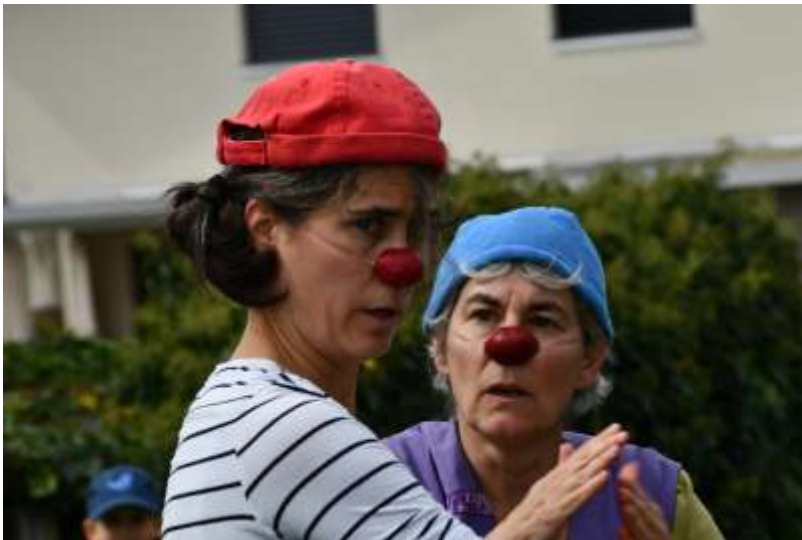
Lola & Peppina

Der ermöglichte Rundgang mit den Angeboten und der Arbeit der Spitex, die lustigen Darbietungen des Clownduo Lola & Peppina sowie die elfköpfige Band „Professor Wouassa“ rundeten den unvergesslichen Tag ab.