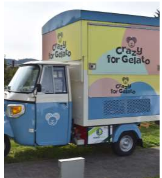
Grazy for Gelato