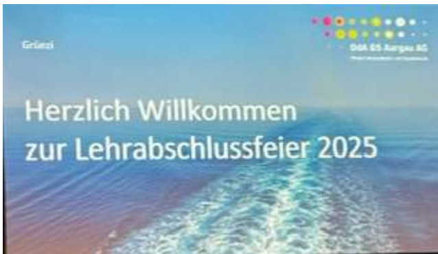
Fotos: Abschlussfeier am 01.07.2025